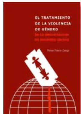
“El tratamiento de la violencia de género por la Organización de Naciones Unidas” Autora: Patricia Palacios Zuloaga. Enero 2011.