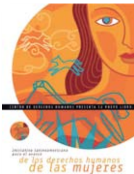
Iniciativa Latinoamericana para el Avance de los Derechos Humanos de las Mujeres Redacción: Marcela Sandoval. Marzo 2009.