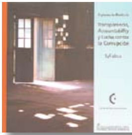
Transparencia, Accountability y Lucha contra la Corrupción – Syllabus Julio 2008.